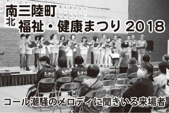
南三陸町北福祉・健康まつり2018 コール潮騒のメロディに聞き入る来場者 沢山の来場者。そして「繋がり」。 9月30日の日曜日、台風24号の警戒の中で、ベイサイドアリーナの総合体育館を全て使い、「南三陸町福祉・健康まつり」が開催された。

発行所 千葉総合印刷株式会社 本吉郡南三陸町志津川字沼田 150-84 TEL(46) 3069 FAX(46)3068 企画・編集 志津川広報センター